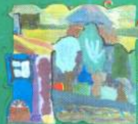
Сіраїш Юля, 9