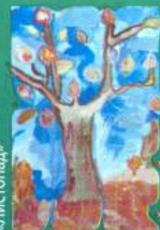
Шеремета Іра, 10 «Листопад»