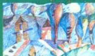
Вербіцька Юля, 10 «Дерева-привиди»