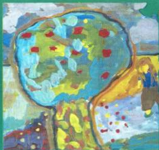
Драч Леся, 9 «І один у полі воїн»