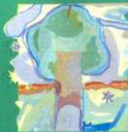
Коломеєць Софія, 9 «Розумне дерево»