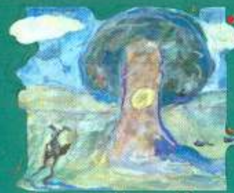
Лисецька Настя, 10 «Дерево космосу»