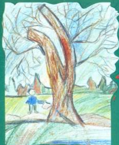
Мялковський Микола, 10 «Живи!...»