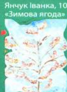
Янчук Іванка, 10 «Зимова ягода»