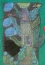
Шоломі Софія, 11 «Хатка для птахів»