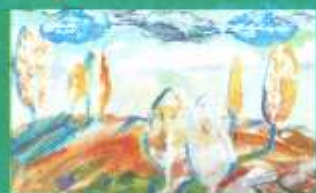
Грицюк Іванка, 7 «Тіні і дерева»